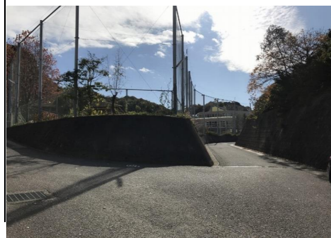
* 現地より姫山小学校を見る